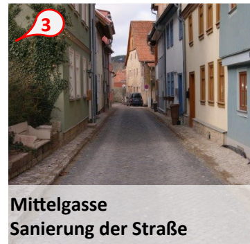
Mittelgasse Sanierung der Straße