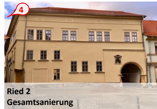
Ried 2 Gesamtanierung