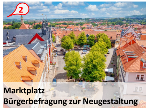
Marktplatz Bürgerbefragung zur Neugestaltung