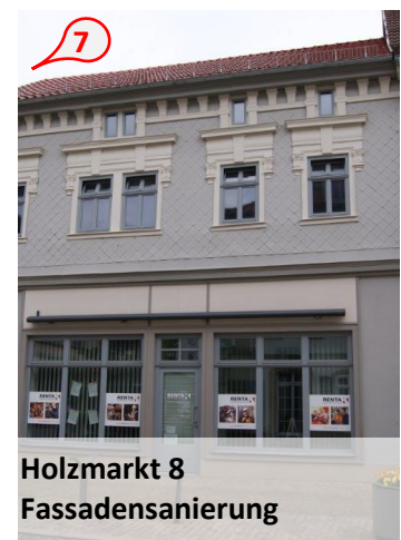
Holzmarkt 8 Fassadensanierung