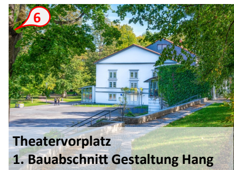
Theatervorplatz 1. Bauabschnitt Gestaltung Hang