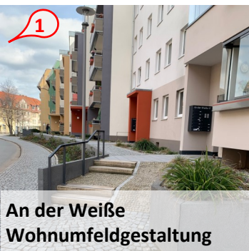
An der Weiße Wohnumfeldgestaltung