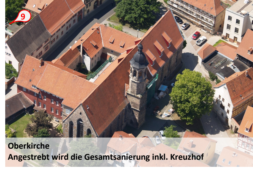
Oberkirche Angestrebt wird die Gesamtanierung inkl. Kreuzhof