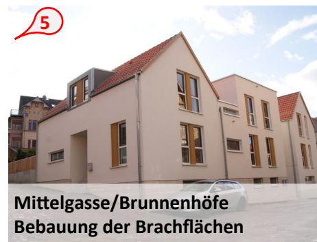
Mittelgasse/Brunnenhöfe Bebauung der Brachflächen